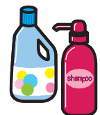
シャンプー・洗剤等 ボトル・ポンプ