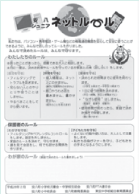
子どもたちが作ったジュニアネットルール