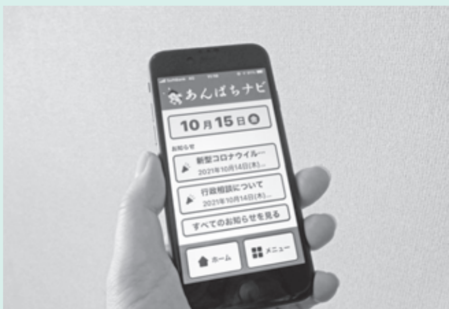
新型コロナウイルス関連の情報も発信する「あんぱちナビ」