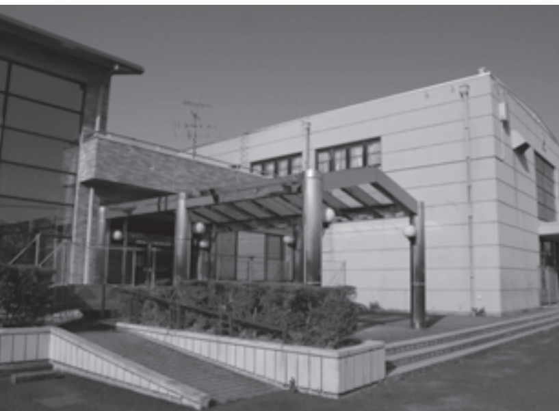
まもなく改修工事が始まる勤労青少年ホーム

公募型プロポーサル方式により決定した、勤労青少年ホームテレワーク化を含む全面改修業務を委託する事業者との契約の締結を、全員一致で可決しました。