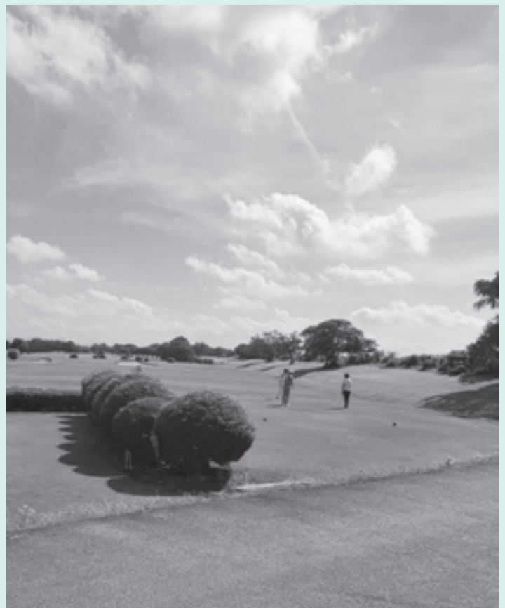
長良川河川敷の安八カントリークラブ

質問 町は、ゴルフ場 土地明け渡しの 強制執行を行うこと にしましたが、強制執行 をしてしまうと、いろ いろな問題が生じるか と思います。ゴルフ場 側の資産などの話し合