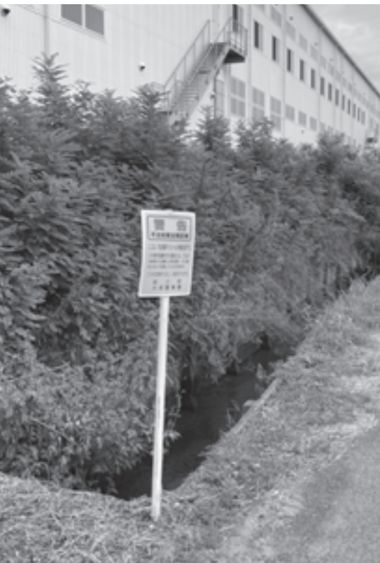
森部地内に立てられた啓発看板

要望 何度も同じ場所にポイ捨てしており、マナーが悪すぎる。不法投棄は犯罪です。看板だけではなく、広報無線など、啓発活動をお願いします。