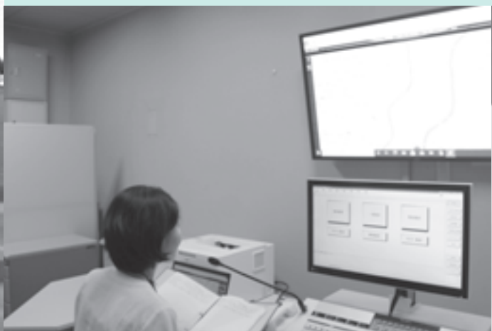
デジタル化された役場内の防災無線基地局