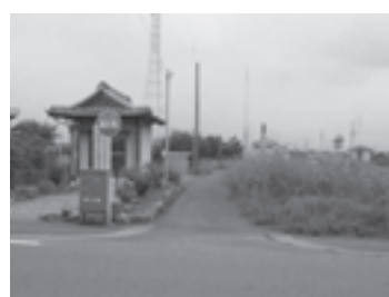
道路改良予定の町道

令和2年度から、市街化区域内の道路拡幅に係る測量・工事（未整備道路4.7kmの内、約900m）を発注・施工しています。