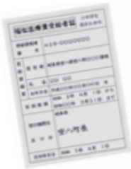
医療機関を受診するときに必要な福祉医療費受給者証

令和3年4月から、高校生世代（18歳となる年度末）までの医療費が無償化になりました。