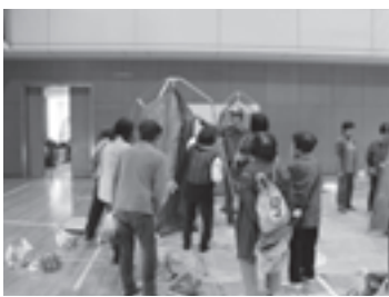
中組防災訓練（平成30年11月号掲載）

避難所に指定されている各施設の更新計画に合わせて、発電機の設置を進めていきます。