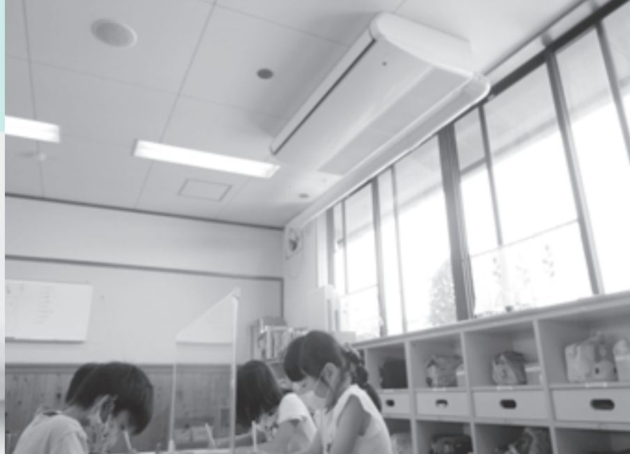
新型コロナ対策として全こども園にエアコンを設置