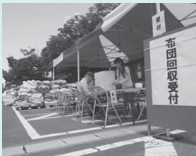
平成29年度から開始されたふとん回収事業

るものや、最終処分場のように、常時搬入が可能なものは住民の皆様にご不便をお掛けしないと思いますが、その他月1回の収集のもの、自宅での保管に困られ、町内外の民間の回収施設に持ち込まれる人もいらっしゃると思います。利便性を向上させるためにも「リサイクルセンター」とまではいかないにしても、定期的な搬入や分別ができるようなシステムの整備を考えています。