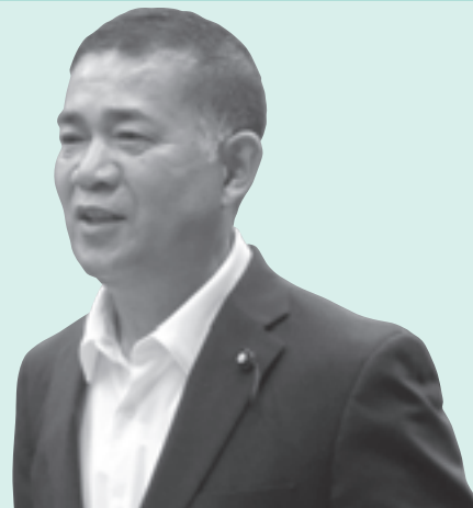
ばん 坂 さとる 悟