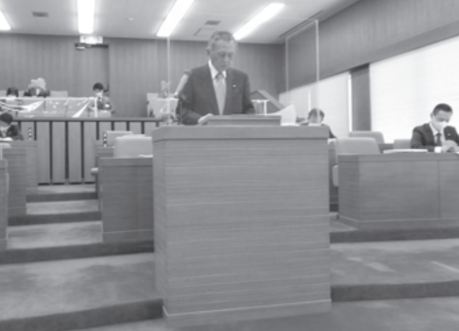
一般質問用の対面式発言台を設置