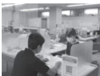
随時行われている納税相談

滞納処分で町税の収入未済額は年々減少していますが、年間約500万円が不納欠損処分されています。