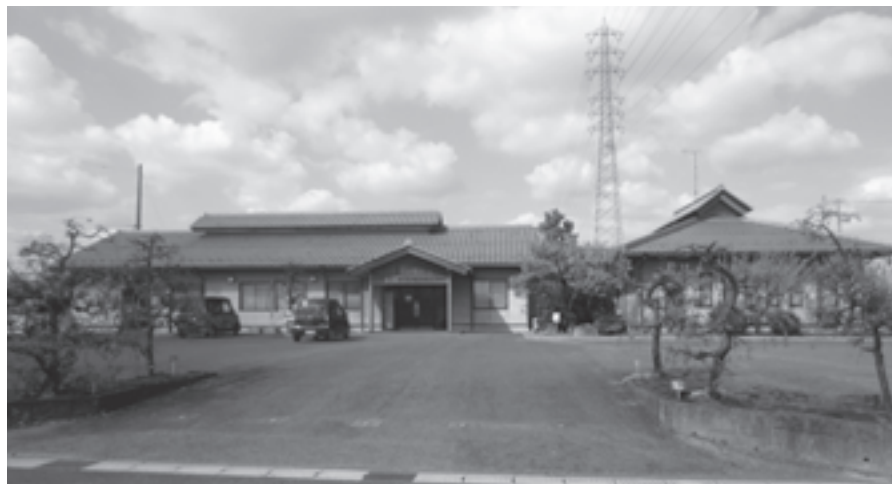
設備改修されるふれあいセンター