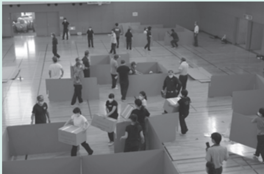
職員による避難所設営訓練（令和2年9月実施 町総合体育館）

回答 原則として、要援護者およびその家族が、自主防災組織、民生委員、支援団体等による支援を得ながら避難することになっていますが、具体的な避難支援プランを作成しておくことが重要ですので、今後、関係機関と協議を進めていきます。