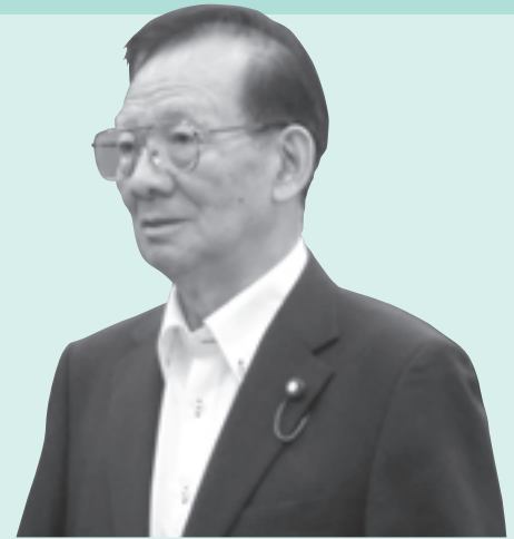
いわお 巖 しまつ 西松