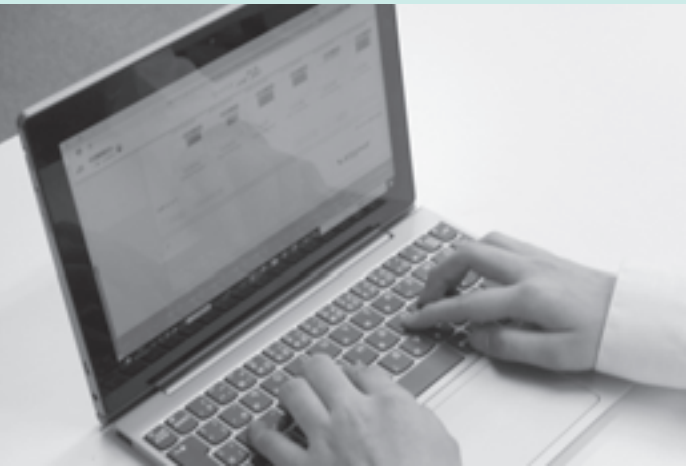
児童・生徒に1人1台のタブレット配布（GIGAスクール）