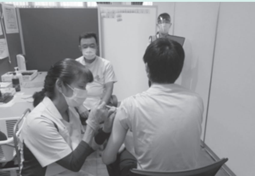
若い世代にも順調に進む新型コロナワクチン接種