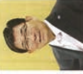
岐阜県知事 古田 肇

また、ドライバーに対しては、横断歩道手前での一時停止はもとより、子供や高齢者を見かけたら速度を控える、周囲を引ける等の「思いやり運転」について広く呼び掛けるとともに、「オール岐阜」で、交通安全啓発のイベントを実施し、関係機関・団体や県民の皆様とともに「オール岐阜」で、交通安全の無い安全・安心な「清流の国ぎふ」の実現に向け取り組んでまいりますので、一層のご協力をお願い申し上げます。