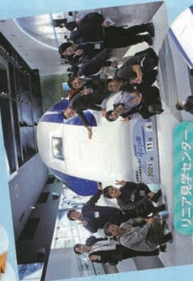
リニア見学センター