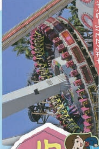
ナガシマスパワールド