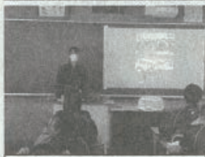
タブレットで教室をつなぎオンラインで(上)