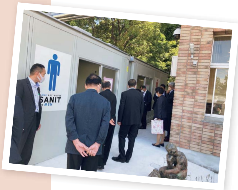
▲放課後児童クラブ名森教室の屋外トイレを視察

住民環境課長補佐 岐阜県の補助事業です。太陽光パネルのみ設置、太陽光パネルと蓄電池をセットで設置した場合が補助の対象となります。補助率は、太陽光パネル1キロワットあたり7万円（上限5キロワット）、蓄電池1キロワットアワーあたり価格の3分の1（上限5キロワットアワー）。なお、蓄電池のみの設置は補助の対象となりません。