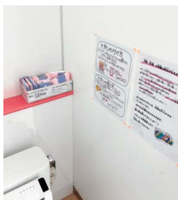
▲トイレに配置された生理用品

答 各校で準備を進め、小学校では、高学年のトイレに配置しました。中学校でも個室に配置できるように準備を進めています。