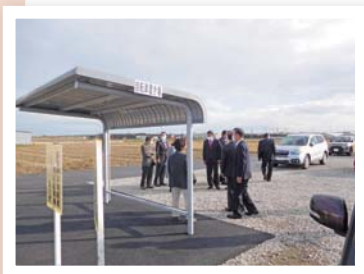
▲待合所を併設予定のにしみのライナー駐輪場

住民環境課長補佐 簡易的なものとなります。素材としては金属製の素材を使用し、屋根と壁は設けて、雨風をしのげるようにします。また、ベンチも設置します。