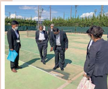
◀テニスコートの危険箇所を確認

総合体育館長 テニスコートは現在2面が人工芝の状態が悪く使用を中止しています。今年1月にスポーツ振興くじの補助金申請を行い、4月に交付決定されましたので、今回補正予算に計上し、張り替えを行います。