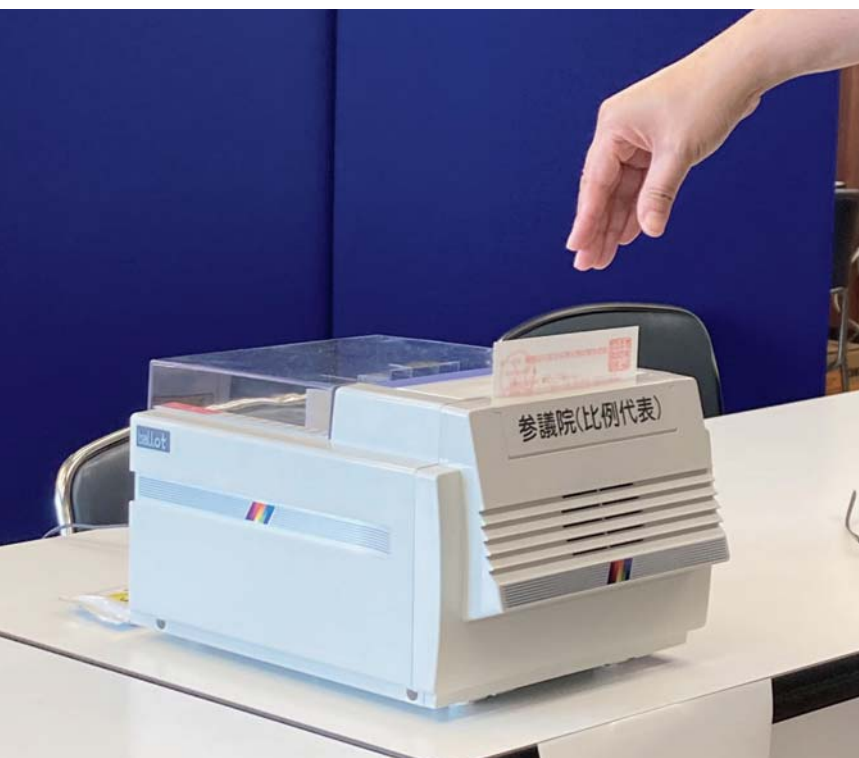
◀購入した投票用紙自動交付機