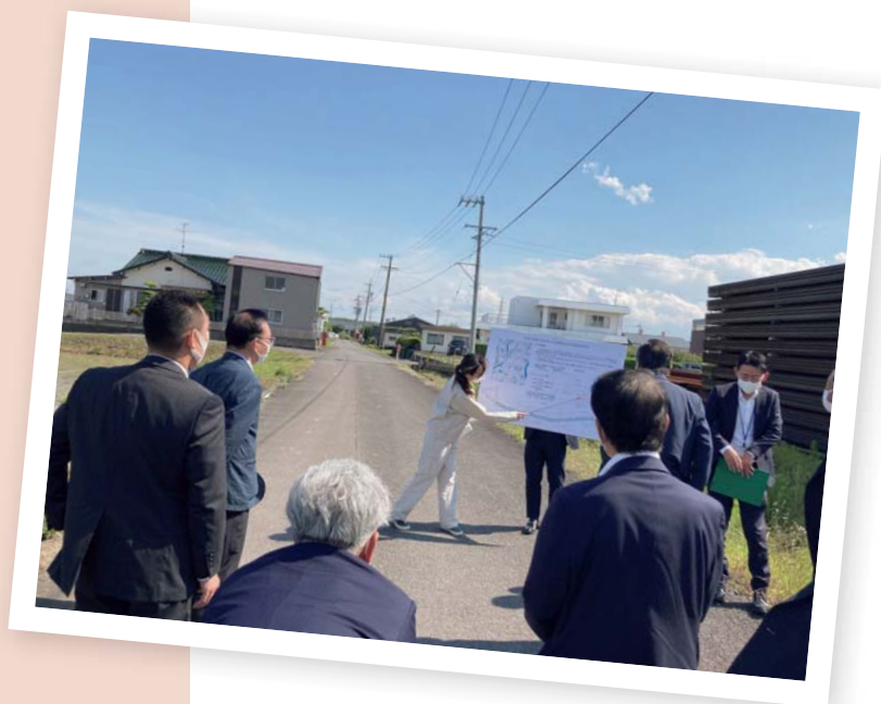
▲中地内の道路改良工事箇所を視察

建設課長 舗装や白線の状態が悪いことは把握しています。通学路でもあるので、教育委員会とも協議しながら検討します。