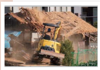
▲取り壊される家屋（イメージ）

総務課長 特定空家として認定し、公費で除却することは可能ですが、税金を使うことになるので慎重に行う必要があると考えています。