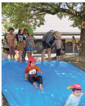
▲木陰でウォータースライダーをして遊ぶ子どもたち