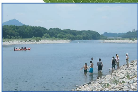
いつまでもきれいな水辺