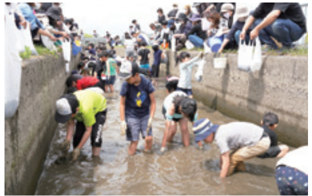
▲素早く泳ぎ回るアマゴを捕まえる子どもたち

ますつかみ大会では、園児と小学生約500人が参加し、水路に入りびしょ濡れになりながら、手づかみやタモを使って夢中でアマゴを捕まえました。