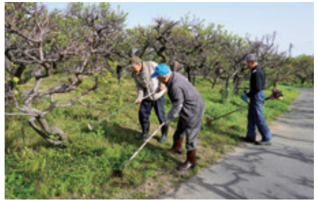
▲コミュニケーションをとりながら、雑草を刈り取ります

百梅園ボランティアは毎月1～2回程行われ、参加は随時受け付けています。詳しくは産業振興課（☎ 64-7113）へお問い合わせください。