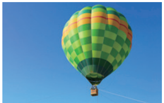
▲空からの景色を楽しみました

気球に乗った児童は「気球を見たことがあったけど、乗るのは初めてでした。高くて良い景色でまた乗りたいです」と話してくれました。