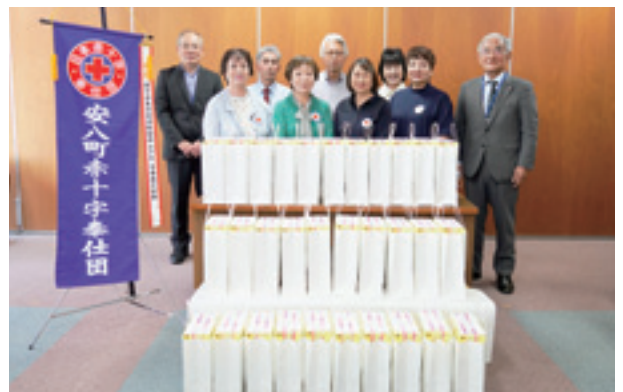
▲一つひとつ心を込めて手渡ししました

当日は民生委員・児童委員さんの協力を得て、町内のひとり暮らしのお年寄り約70人に直接届けられました。