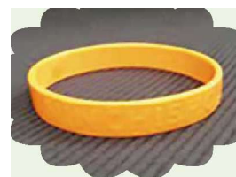
認知症サポーターの証 「オレンジリング」

地域の集まりや職場やサークル等、町内で集まる場があれば出張講座も可能です。 ※講師料・テキスト代等:不要