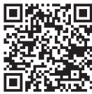
確定申告書 作成コーナー マイナポータル 連携特設ページ

相談時間 午前の部 9：00～12：00（受付終了は11：30） 午後の部 13：00～16：00（受付終了は15：30）