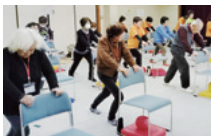
椅子を使ったストレッチ