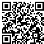
▲裁判所ウェブサイト