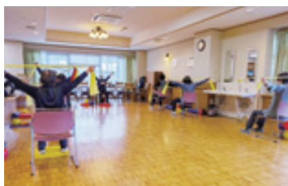
ゴムを使った上腕を鍛える体操