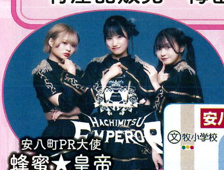
安八町PR大使 蜂蜜★皇帝