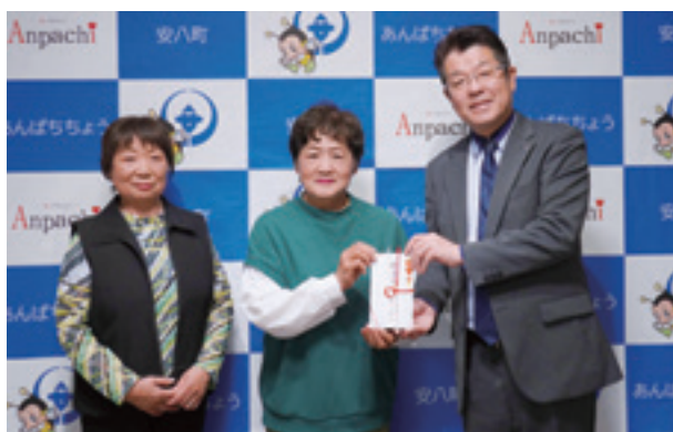
▲アンヒルパークボランティア代表の皆さん