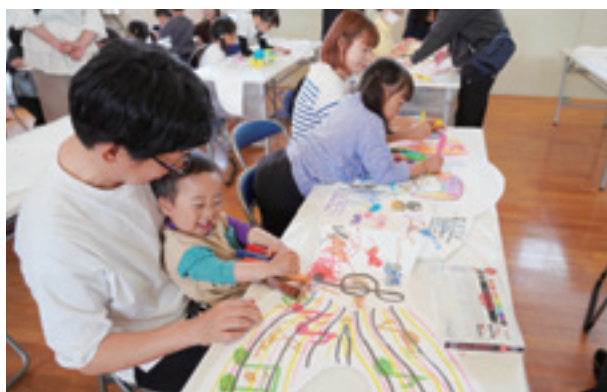
▲思い思いの鯉のぼりを制作する参加者

この鯉のぼりは4月29日（水）～5月7日（木）まで、役場周辺に子どもたちの健やかな成長を願う風景として掲揚される予定です。