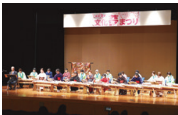
▲日頃の練習の成果を披露しました