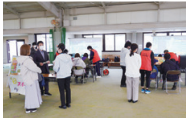
▲eスポーツを楽しむ参加者