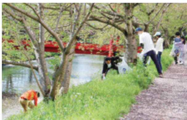
▲中須川沿いのごみを拾う社員とその家族

参加した方は「地域の皆さんが気持ちよく過ごせる環境づくりに貢献できればと思い参加しました」と話されました。