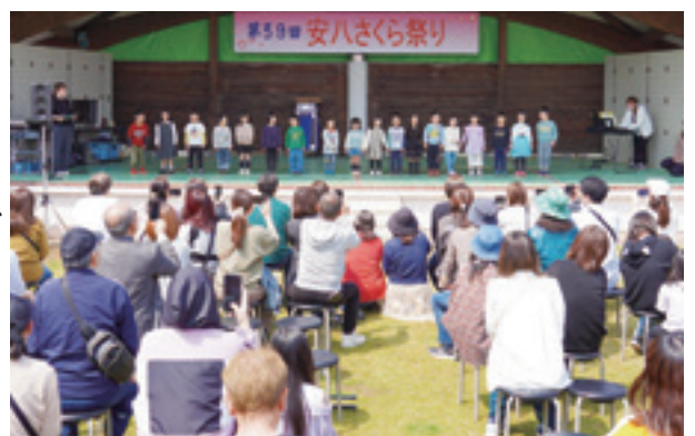
▲中央こども園児による歌の披露

参加した方からは「満開の桜とタイミングがちょうど良く、盛り上がった」と笑顔で話してくれました。