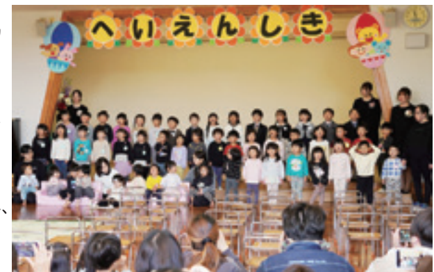
▲園児全員による歌の披露

式の終盤には、先生と園児全員による歌や手遊びが披露され、会場は温かな拍手に包まれました。ふたばこども園は現在、子育て支援施設『よつばの森』として新たな役割を担い、一步を踏み出しています。