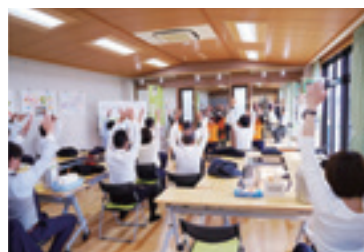
▲リニューアルした健康増進施設